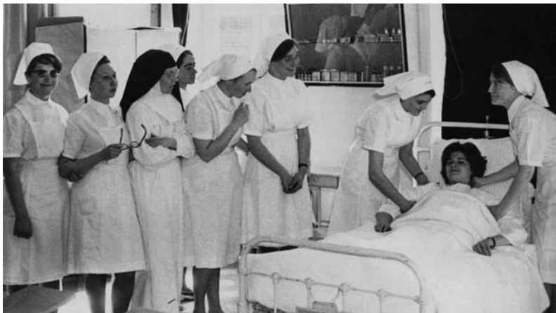
Travaux pratiques avec une religieuse hospitalière en 1963

La présence de la congrégation des Filles de l'Enfant Jésus s'est maintenue très longtemps à Dunkerque. Les sœurs ne quitteront l'hôpital de Dunkerque qu'à la fin des années 1970. Ainsi, le développement de l'activité des hôpitaux et la professionnalisation progressive du personnel ont abouti à la laïcisation des services hospitaliers.