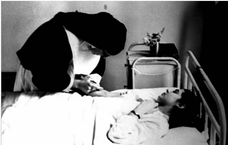
Sœur hospitalière donnant des soins prescrits par les médecins

Au niveau national, des dispositions sont prises pour encourager les initiatives portant sur la création d'écoles d'infirmières. Le 17 juillet 1899, une circulaire demande aux préfets d'encourager les municipalités et les Commissions Administratives à créer ce genre d'écoles. Dans la séance du 24 décembre 1902, la Commission Administrative des Hospices civils de Dunkerque prend connaissance de la circulaire ministérielle et émet un avis défavorable à la création d'une école d'infirmières.