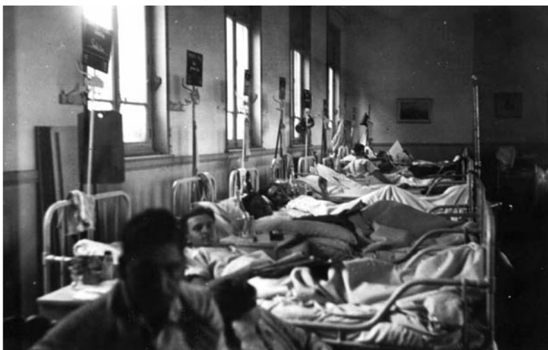
Soldats allemands au sein de l'hôpital

Avec la signature de l'armistice, l'administration reprend possession de son hôpital avec une centaine de malades allemands encore présents au sein des pavillons. Les sœurs hospitalières sont de retour à Dunkerque et sont initiées aux soins infirmiers de la médecine moderne.