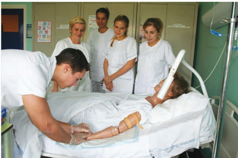
Travaux pratiques à l'Institut, IFSI

C'est à Dunkerque que le 22 mai 2007, le Président de la République Nicolas Sarkozy annonce aux infirmiers « l'attribution d'une licence pour trois ans d'études après le Baccalauréat ». Le statut d'étudiant est affirmé.