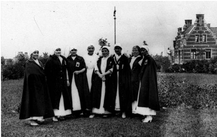
Infirmières bénévoles durant la Première Guerre Mondiale, AMDK

Au total, durant le conflit, l'hôpital civil de Dunkerque compte à son service trente-trois sœurs hospitalières, vingt-deux infirmières laïques et soixante-sept bénévoles. Cette présence des infirmières de guerre, bénévoles, laïques ou militaires dans les hôpitaux lors de la Grande Guerre contribua à l'émergence de la profession d'infirmière au début du xx e siècle.