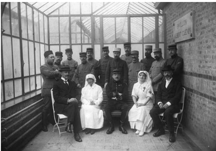
Infirmières de l'hôpital avec des militaires dans le pavillon Cuenin, CHD

La reconnaissance professionnelle des infirmières est définitivement acquise avec la création du diplôme le 27 février 1922. Alexandre Millerand, alors Président de la République, signe le décret qui constitue le véritable acte de naissance de la profession en France.