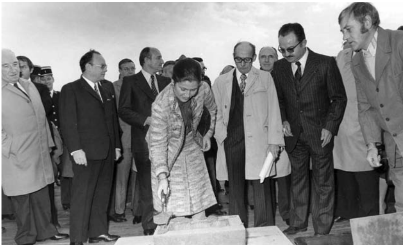
Pose de la première pierre de l'école d'infirmières par Simone Veil, Ministre de la Santé, CHD

L'augmentation des effectifs conjuguée à l'allongement des études crée une affluence d'élèves infirmiers et d'élèves aide-soignants, qui pose la question de son agrandissement. Le 18 octobre 1976, Madame Simone Veil, Ministre de la Santé, pose la première pierre de la nouvelle école d'infirmières de Dunkerque qui doit accueillir 210 élèves et disposer d'un hébergement de 51 chambres.