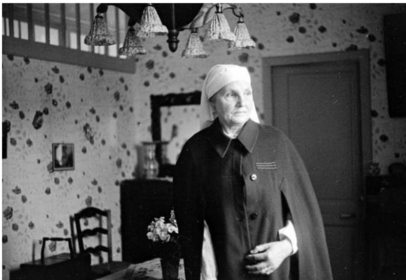
Infirmière se préparant à regagner l'hôpital civil

En 1944, tous les malades sont transférés vers Bailleul, Armentières, Roubaix, Tourcoing et Cambrai. Dès le début du siège de la poche de Dunkerque en septembre 1944, l'hôpital est occupé dans sa totalité par les services sanitaires de la Croix-Rouge allemande. Les services de l'hôpital s'installent alors à Socx, dans un ancien orphelinat.