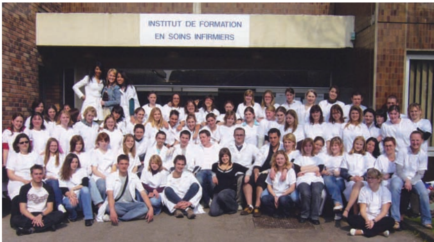
Elèves de 1 ère année de l'institut de formation en soins infirmiers, IFSI

L'organisation des études intègre en partie des modèles universitaires et le programme incite à des partenariats avec l'université. L'école d'infirmières devient Institut de Formation en Soins Infirmiers (IFSI) et voit ses missions élargies. A cet effet, l'institut élabore un projet de formation préparatoire avec le CUEEP du Littoral.