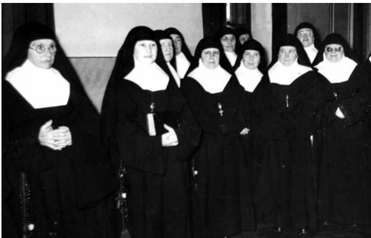
Communauté des Filles de l'Enfant Jésus dans les années 50

En effet, la création d'une école entraînerait pour l'administration des dépenses que l'état de ses finances ne lui permet pas. D'ailleurs, au sein de l'hôpital, des cours magistraux, des répétitions, généralement du soir et d'une durée inférieure à un an, sont ouverts aux personnels de service.