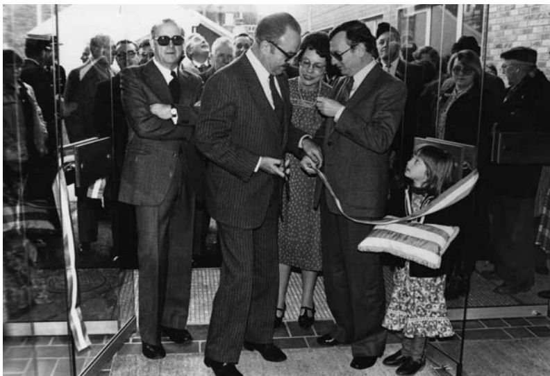
Inauguration de l'école d'infirmières par le Maire de Dunkerque Claude Prouvoyeur

Elle est remplacée en septembre 1987 par Françoise Faes, elle-même ancienne élève (promotion 68-70) et ancienne monitrice de l'école de 1976 à 1984.