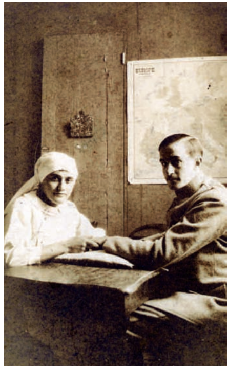
Infirmière prodiguant des soins à un soldat

Toutes travaillent sous l'encadrement de directrices, sœurs-infirmières souvent plus âgées, expérimentées et responsables des différentes salles de soins.