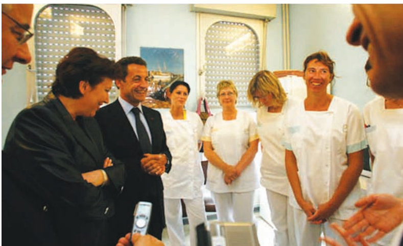
Le Président de la République, Nicolas Sarkozy, entouré des infirmières lors de sa visite au C.H.D. le 22 mai 2007

Le référentiel de formation centré sur la professionnalisation et l'inscription de la formation dans le système Licence Mastère Doctorat est arrêté en Mai 2009. La formation est organisée en semestres et prévoit une large participation des universitaires dans l'enseignement et la validation. L'IFSI de Dunkerque avec les quatre IFSI du Littoral a engagé un partenariat avec l'Université du Littoral Côte d'Opale (ULCO) dès la rentrée 2009. En stage, les soignants valident les compétences au travers des activités.