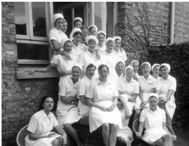
Promotion 1971-1973 de l'école d'infirmières, IFSI

C'est également à cette époque que les stages hospitaliers s'étendent à l'hôpital maritime de Zuydcoote. À partir de 1979, la formation d'aide-soignante, auparavant assurée par le centre hospitalier est confiée à l'École. De 1979 à 1985 quatre promotions sont formées pour le CHD en fonction des besoins.